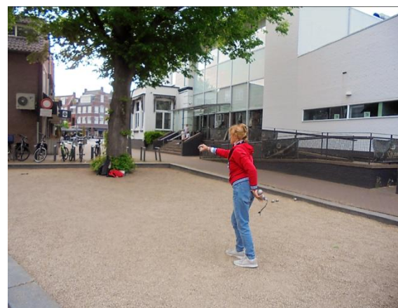
Baan in het centrum van Rosmalen.