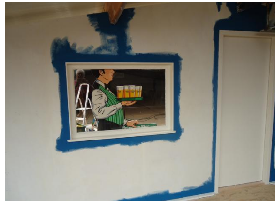
De zolder begint te gloren.