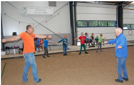
Een warming-up hoort er bij.