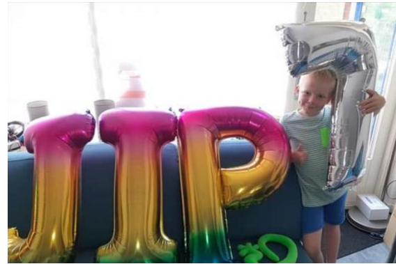
Na terugkomst uit Frankrijk, vierde Jip zijn verjaardag (7 jaar).

Opgesteld door een aantal deelnemers van het Nederlandse team.