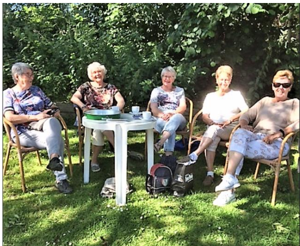
15 juni: warme ochtend, 9.00 uur in de ochtend zaten 5 dames in de schaduw al koffie te drinken, al snel werd de groep steeds groter! Mooi zo'n (warme) club!