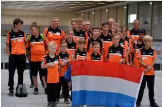
Jip mocht de vlag dragen.

Douai. Bij binnenkomst van deze nieuwe bouldrome en de grootte hiervan was voor de meeste een mooie ervaring en wat een kind beaamde wilde ze gelijk gaan gooien en wij even relaxen.