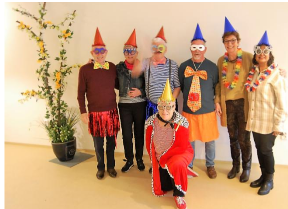
'Voor de derde wedstrijd, de funwedstrijd, kunnen deelnemers zich inschrijven, waarna zes spelers worden geloot. De zevende is de scheidsrechter.'