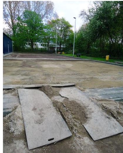
Renovatie van de buitenbanen is begonnen.