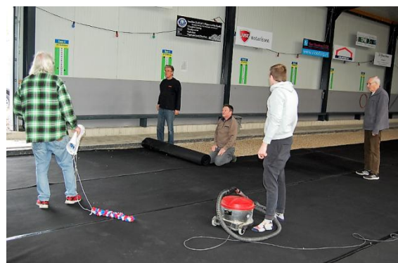
Uitrollen van de vloerbedekking.

Wat zo bijzonder is, twee dagen nadat onze zaal in een Frans decor was omgetoverd, was weer alles als vanouds. Alsof er niets had plaatsgevonden. Een grote pluim voor alle vrijwilligers die zich hebben ingezet, in zowel de voorbereiding als in het afbouwen. Wat een dynamiek en enthousiasme, dat maakt JBC Zoetermeer zo bijzonder!