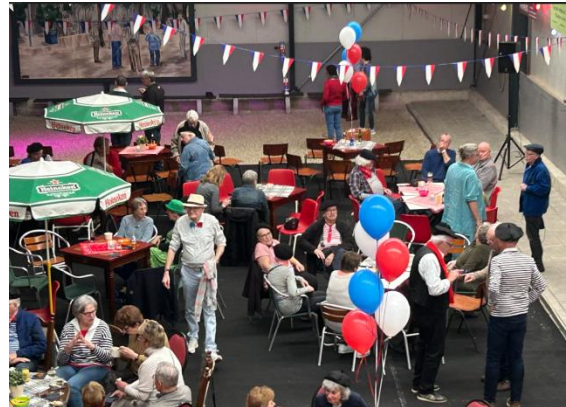
Gezelligheid, eten en drinken en een potje boulen.