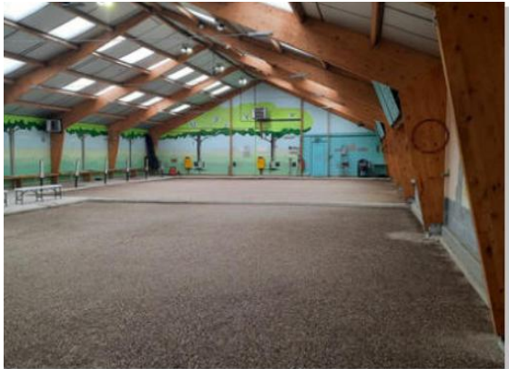
De binnenhal van Les Francophiles.

Maar goed, in de tweede competitiehelft waren er nog zes wedstrijden te gaan. We waren dan ook gemotiveerd om die laatste plaats waar we nu op stonden te verlaten. Elke NPC-wedstrijd was tot nu toe gezellig en de middag werd steeds afgesloten met een gezamenlijk diner. Dat zou ook de rest van het seizoen zo blijven en wij gingen ons best doen om het kwartje wat vaker naar ons te doen vallen (en dan bedoel ik natuurlijk niet bij de toss).