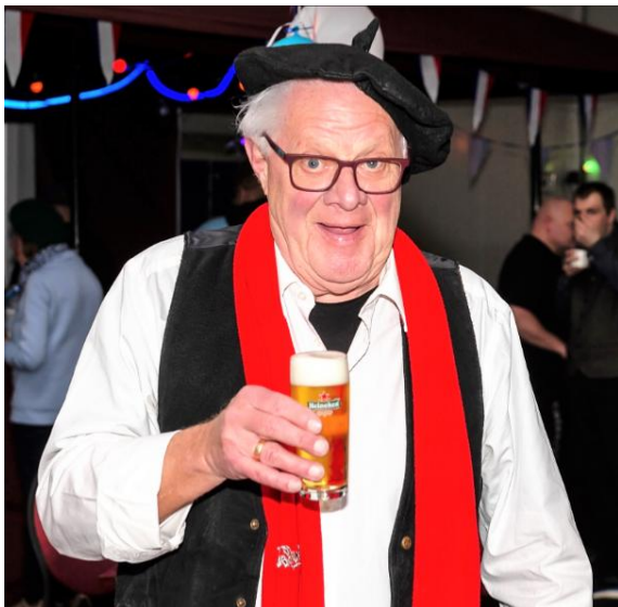
De vicevoorzitter houdt niet alleen van wijn.