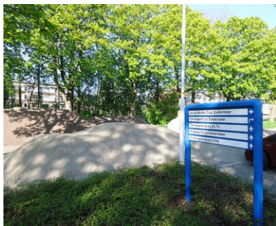
Hier ligt een deel van ons verleden.