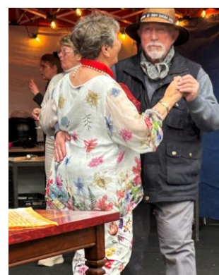
Voetjes van de vloer.