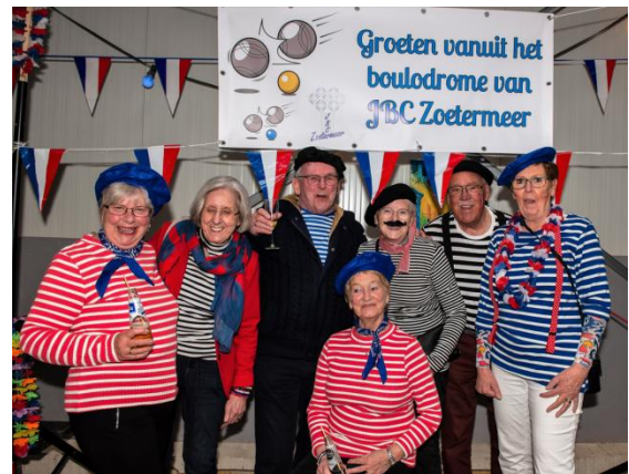
Wat een feest!