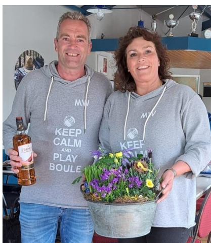
Het blijft in de familie (Paastoernooi Waddinxveen).