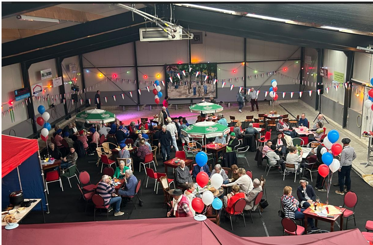
Franse gezelligheid op 19 maart: 45- jarig jubileumfeest.