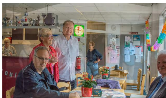
Kantine van Les Boulistes.

Ik hoopte maar dat het geen traditie zou gaan worden want tegen de gelijkwaardige tegenstanders Les Francophiles 2, Nieuwerkerk 2, Cercle de petanque 1 en Nederlek 2 verdwenen voorsprongen als sneeuw voor de zon en werd er verloren waar dat zeker niet nodig was, telkens met 3 - 5.