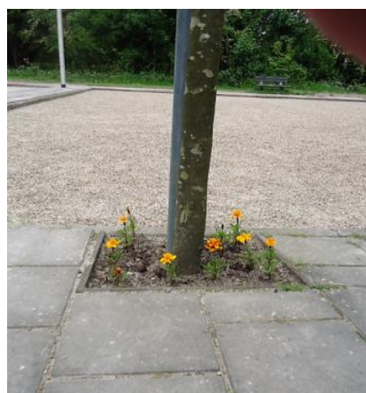
Het geluk zit soms in een klein hoekje.