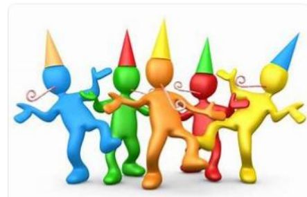
Ook bekend bij de FiBoLu deelnemers.