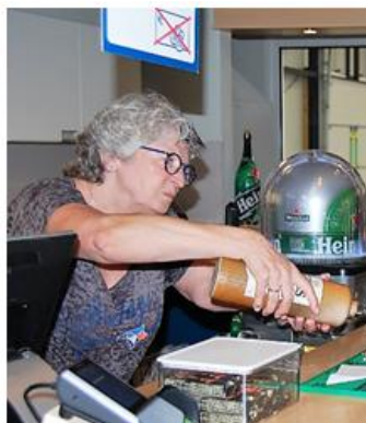
Met een Korenwijntje.