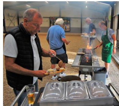
Regen: dan doen we het gewoon binnen!