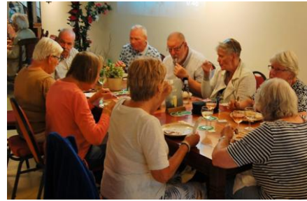
Zowel buiten als binnen.