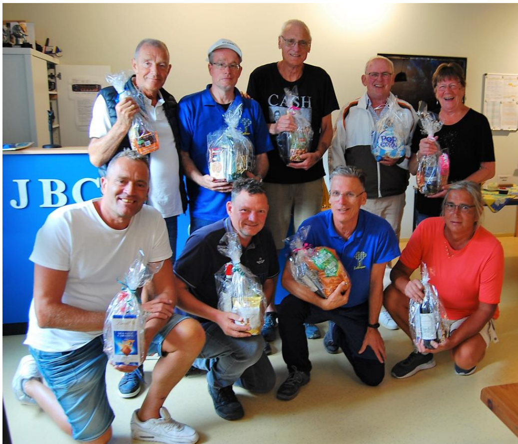
Het Thuisblijvers Toernooi resulteerde in negen winnaars (zie pagina 10).