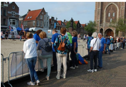
Een aantal JBC Zoetermeeders had zich verenigd om onze teams aan te moedigen.