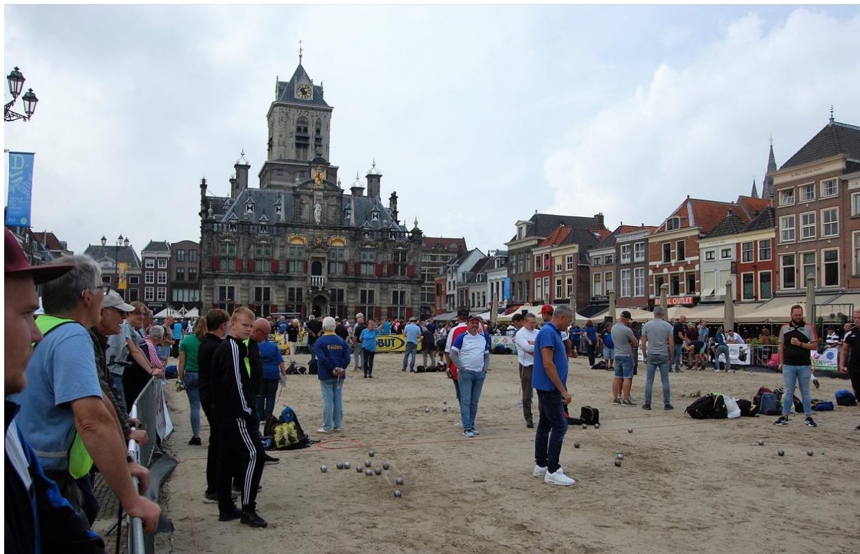
160 teams speelden op het Boule d' Orange markttoernooi te Delft.