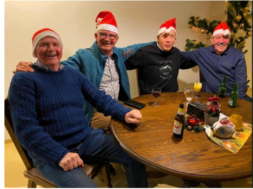
De kerst zit er goed in.