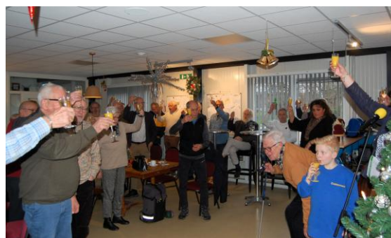
De gezamenlijke 'heildronk'.