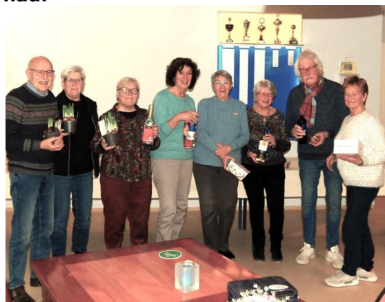
Winnaars van rechts naar links.

dagen maakten op het land en veel energie nodig hadden om het zware werk te kunnen verrichten. Daarnaast was stamppot een goedkoop éénpans- of éénpotsgerecht dat gemakkelijk in grote hoeveelheden gemaakt kon worden en waar de kok weinig werk aan had.