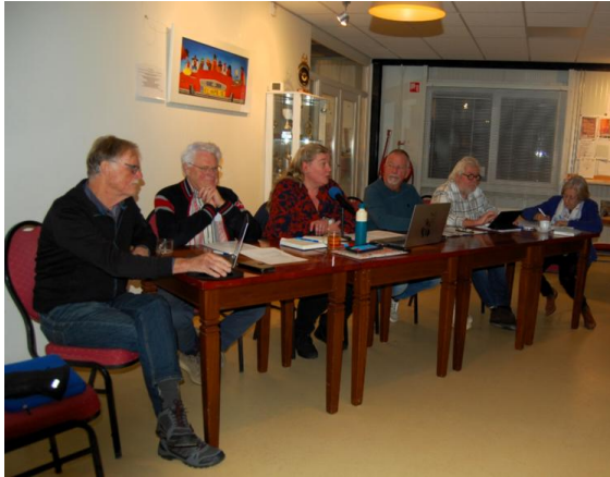
De vergadering wordt geopend.