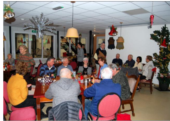
Het Luiten Food Intern Vleestoernooi wordt hoog gewaardeerd.