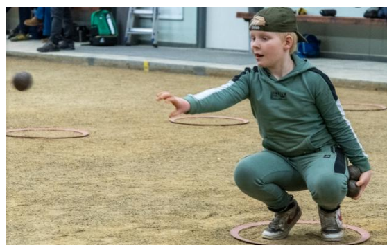
Jip bij een landelijke training.

Vanaf januari 2025 worden er op vier verschillende locaties in het land regionale trainingen georganiseerd voor jeugd- en beloftenspelers. Hiervoor zijn afspraken met verenigingen gemaakt en er zijn regiotrainers aangesteld. Binnenkort kunnen spelers zich aanmelden voor deze trainingen op de website van de bond. De regionale trainingen zijn toegankelijk voor alle spelers onder 23 jaar.