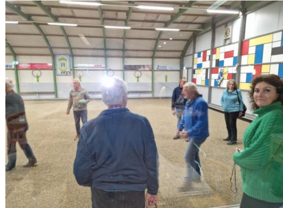
Aan aantal leden van ons maakte er gebruik van en waren enthousiast over 'de bal in de zak'.