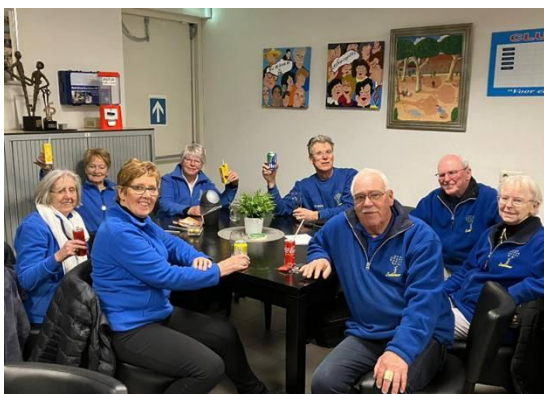
Met de sfeer zat het wel weer goed. 7-1 verlies tegen Les Francophiles 2.

Wij hadden halfweg de competitie zes wedstrijd punten, een puntje meer dan vorig jaar in een halve competitie. We hebben echter wel twee wedstrijden gewonnen wat ons vorig jaar niet is gelukt. Wij kijken optimistisch naar de tweede competitiehelft.