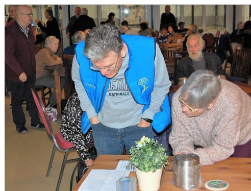
Tegen wie moeten we?