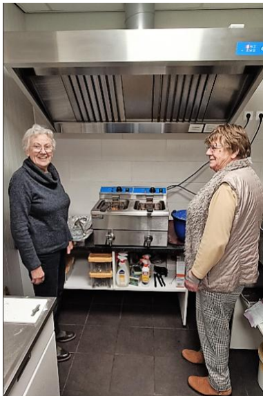
Met dank aan de oliebakkers.