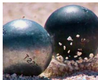
Het sterkste team van JBCZ op plaats 10: Roland van Baalen, Theo van der Tak en Theo Meijer 2 -1