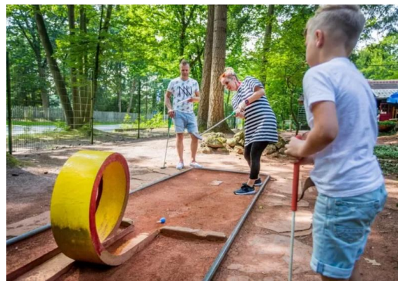
Midgetgolfbanen zijn door de verschillende hindernissen elke keer weer een uitdaging. Sla de bal door de looping, over een schans of een hole-in-one bij hole 18.

‘Snoeien gebeurt alleen als er nog geen nieuwe huurder is gevonden, want de gemeente gaat de locatie tijdelijk verhuren tot de nieuwe visie voor het park en omgeving klaar is. Ook de verouderde skatebaan, 2B-Home en Era Contour worden aangepakt. De gemeente heeft al diverse bezichtigingen gehad en gesprekken gevoerd over een tijdelijke invulling voor het terrein. Dat kan weer midgetgolf zijn, maar het kan ook worden gehuurd door een andere (sport)vereniging.’