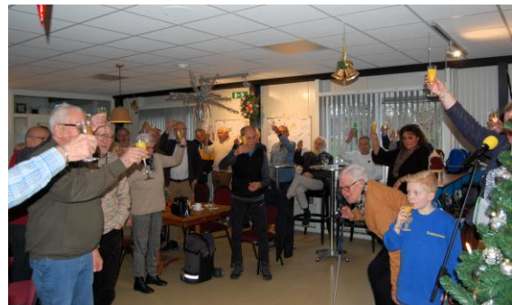
De gezamenlijke 'heildronk'.