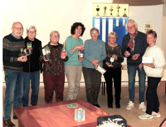
Winnaars van rechts naar links.

dagen maakten op het land en veel energie nodig hadden om het zware werk te kunnen verrichten. Daarnaast was stamppot een goedkoop éénpans- of éénpotsgerecht dat gemakkelijk in grote hoeveelheden gemaakt kon worden en waar de kok weinig werk aan had.