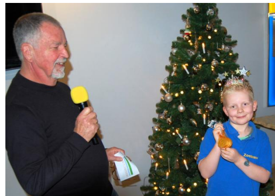
Joop en Jip.