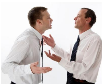
door Frans Roos