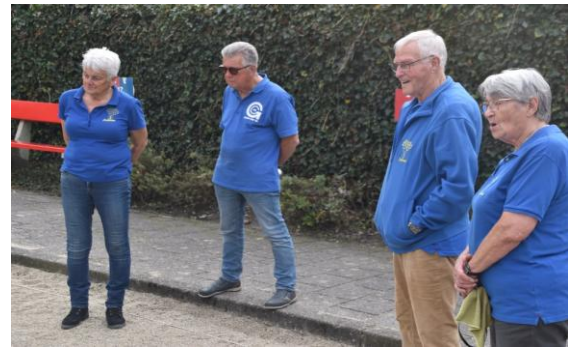
Teamleden die gespannen toekijken.