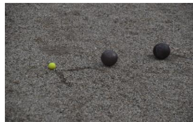
Het prachtige resultaat: de boule van Karin ligt dicht bij het but.