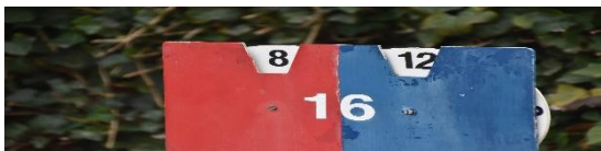
De kansrijke stand.