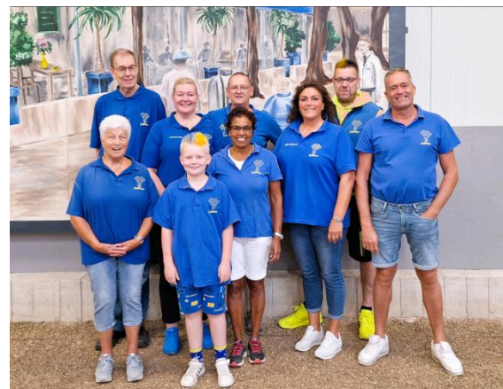
JBC Zoetermeer 1 (met mascotte Jip).

Er waren 90 teams bij de doubletten. Het systeem was A, B, C en D poule. Zij haalden de A poule. Na drie wedstrijden werden zij uitgeschakeld.