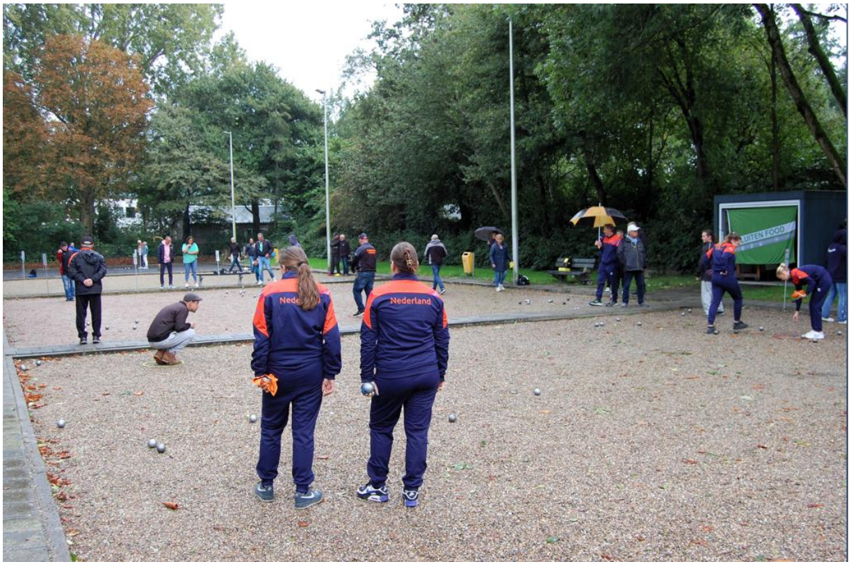
Bij het Luiten Food Toernooi was ook de Nederlandse top aanwezig.