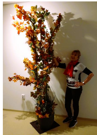
De herfst is ingetreden.