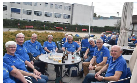
Het lachende team, blij met de eerste overwinning.