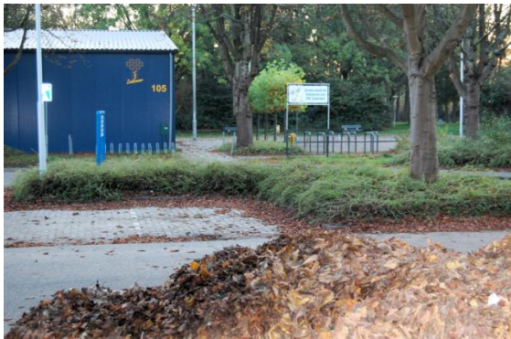
Herfst bij ons bouldrome.