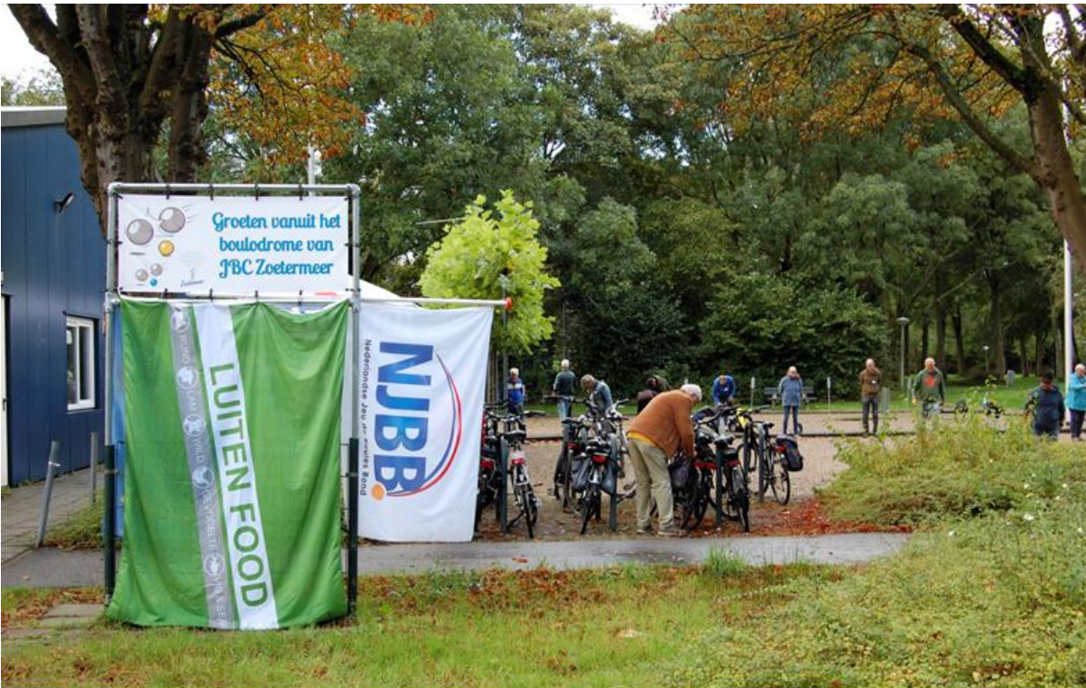
De entree van het Luiten Food Open Zoetermeerse kampioenschap.

Jeu de Boulesclub Zoetermeer Opgericht: 6 maart 1978 Uitgave: oktober 2024, 7e jaargang nummer 5