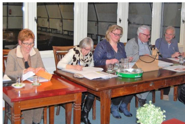
Op 19 maart jl. werd de A.L.V. gehouden.