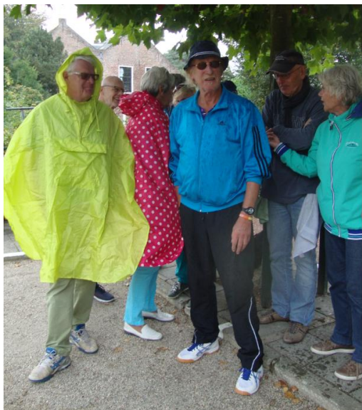
Een buitje kan de pret niet drukken.