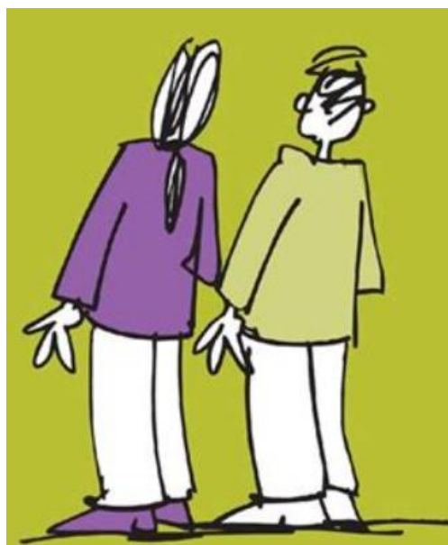
Neem iemand mee!