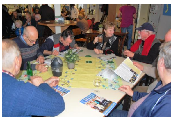
Hier wordt gretig gelezen in het jubileumnummer 'Mijn JBC Zoetermeer.'