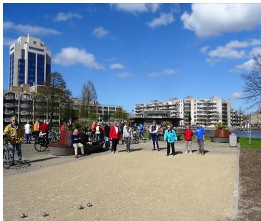
Iedere maandagmiddag, gezellig druk bij petanque aan de Dobbe.