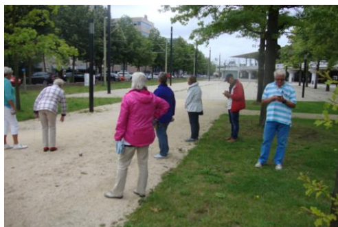
Is er een Pokomon in de buurt?

We verzamelen om 9:45 uur en om 10:00 uur exact geeft Els het vertreksein. Doet u dit jaar mee?