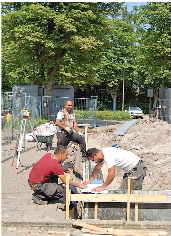
4 juli 2018