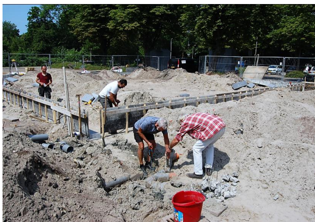
4 juli 2018