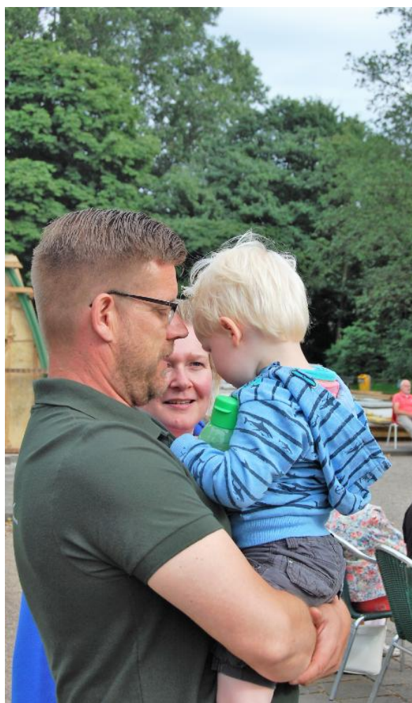
Jip moet nog even wachten.

De mooiste jeugd is een jeugdige geest als je niet meer jong bent.