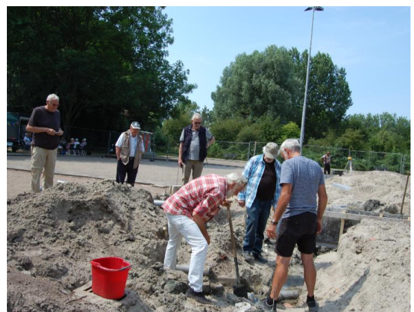
4 juli 2018