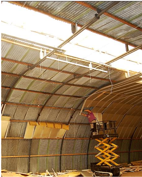
13 juni 2018