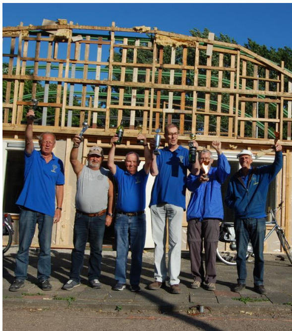
Op de achtergrond het ten dele gesloopte clubhuis (boulodrome) van JBC Zoetermeer.

Bij de onlangs gehouden doublettenkampioenschappen (twee tegen twee) in het Burgemeester Vernedepark bij Jeu de Boulesclub Zoetermeer, speelde de strijd zich af met op de achtergrond het ten dele gesloopte clubhuis (boulodrome) waar vele Zoetermeeders mooie herinneringen aan bewaren ( 1991- 2018).