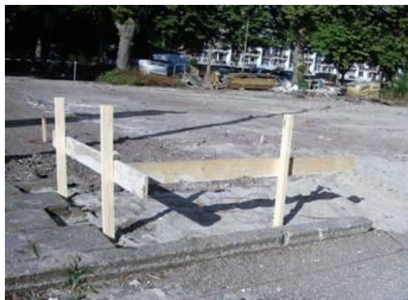
27 juni 2018