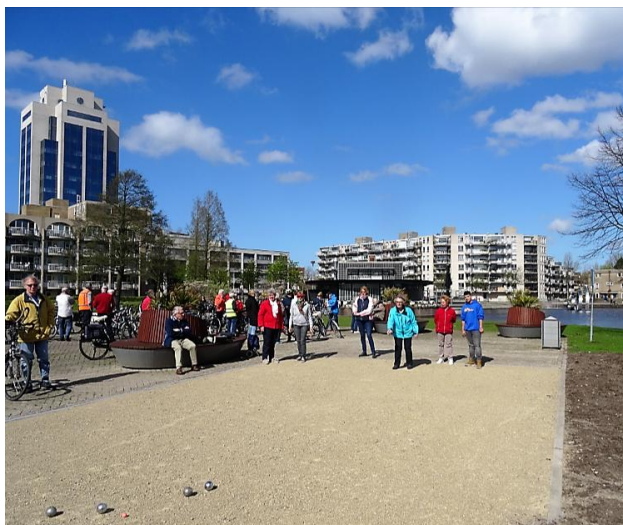
Iedere maandagmiddag, gezellig druk bij petanque op het Dobbe-eland.