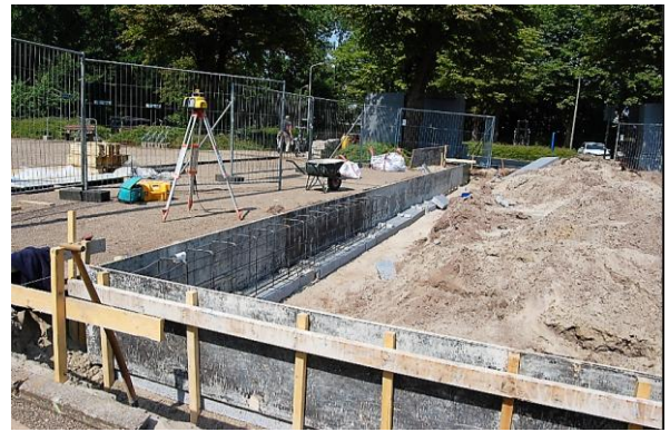
4 juli 2018