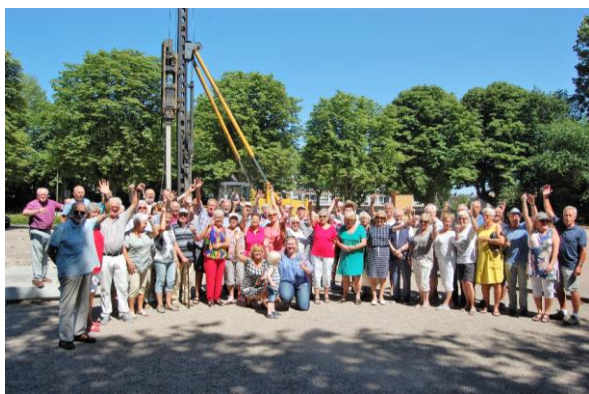
Een groot aantal leden van JBC Zoetermeer met de wethouder en de voorzitter in het midden.