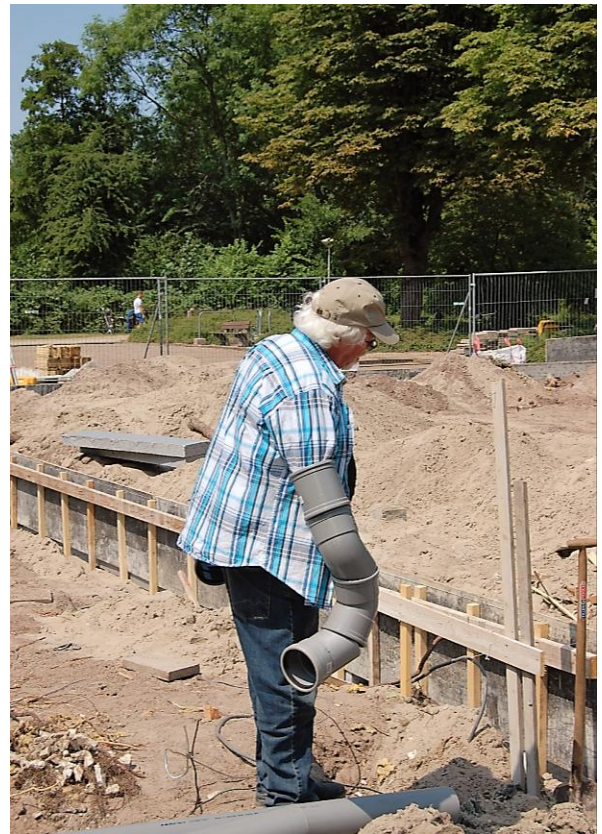
4 juli 2018