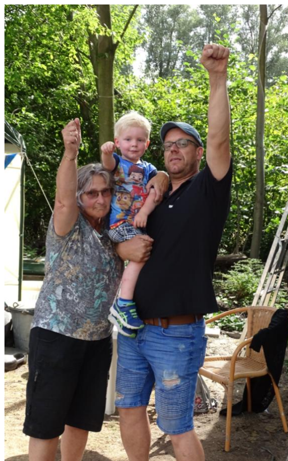
Zit Jip nu al bij wedstrijd zaken?