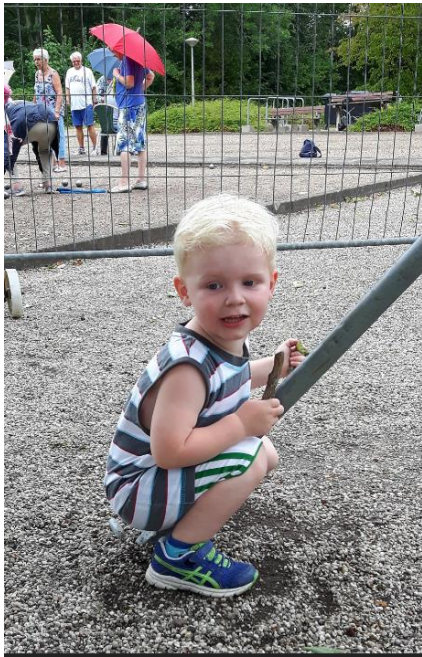
Jip is nu al gek op ijzer.