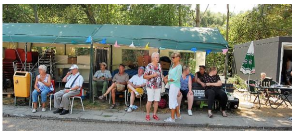
Costa la JBC Zoetermeer