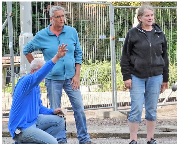
Op weg naar de titel.