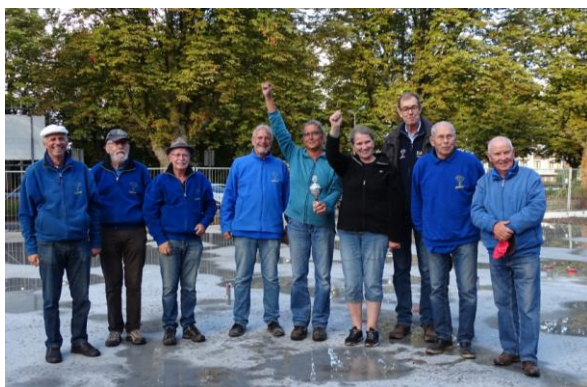
De nummers 1, 2 en 3 op de vloer van onze nieuw kantine.

Hoewel de weersvoorzichten niet goed waren werd het toernooi, na enige discussie, toch gehouden. De speelvelden waren gedeeltelijk zeer nat. Dit zorgde voor een extra moeilijkheidsgraad. Voor velen een uitdaging.