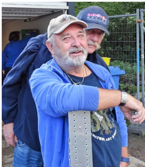
Aan elkaar gewaagd.