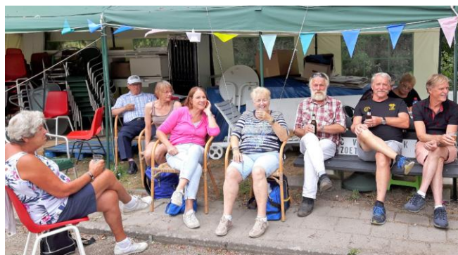
Costa La JBC Zoetermeer.