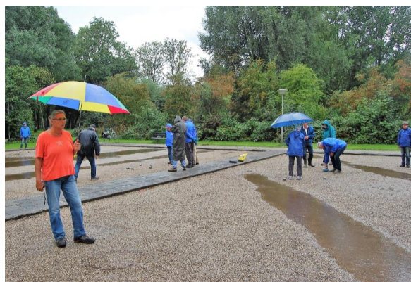
De regen wordt getrotseerd.