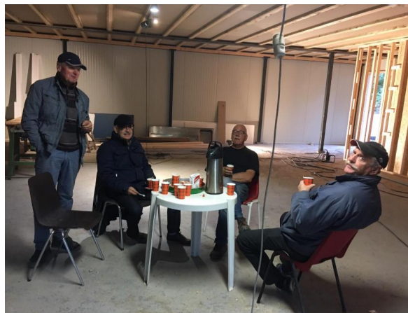
(Vrijwilligers houden even pauze).

Met Vriendelijke Groeten, Namens het bestuur Annemiek de Vos Voorzitter