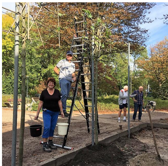
(Vrijwilligers aan het werk)