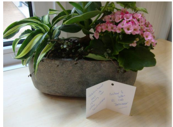
Rotary Club Zoetermeer