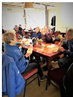
De 'aardappeleters' van JBC Zoetermeer - 5 mei jl.