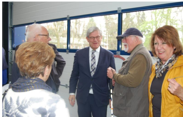
Met Frans van Straaten

Een aantal leden lieten zich niet de kans ontnemen en maakte een praatje met de burgemeester. Niemand kwam op het idee om een selfie te maken, dat past ook niet, en ook niet bij onze leeftijd. De fotograaf deed wel wat van hem werd verwacht. Hij wist de ongedwongen sfeer in beeld vast te leggen.