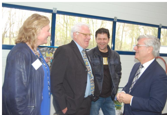
Met de bouwer ...