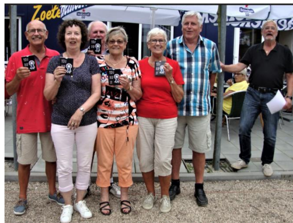
Kampioen – De Invliegers.

Het was een geslaagde dag met mooi weer. Nogmaals wil ik bedanken de leden achter de bar en natuurlijk alle spelers. De bitterballen waren lekker.