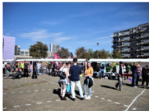
Voorafgaande de Nationale Sportweek werd op zondag 22 september een sportmarkt gehouden.

De PR is momenteel onderbezet, en dat kan natuurlijk niet gezien onze nieuwe uitstraling. Zie je ook in dat onze club verder moet groeien en heb je goede ideeën waarvoor je je wilt inzetten, meld je bij Frans Roos.