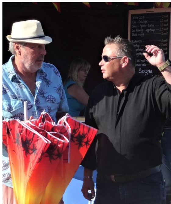
Organisatie – twee zonen van twee van onze leden.