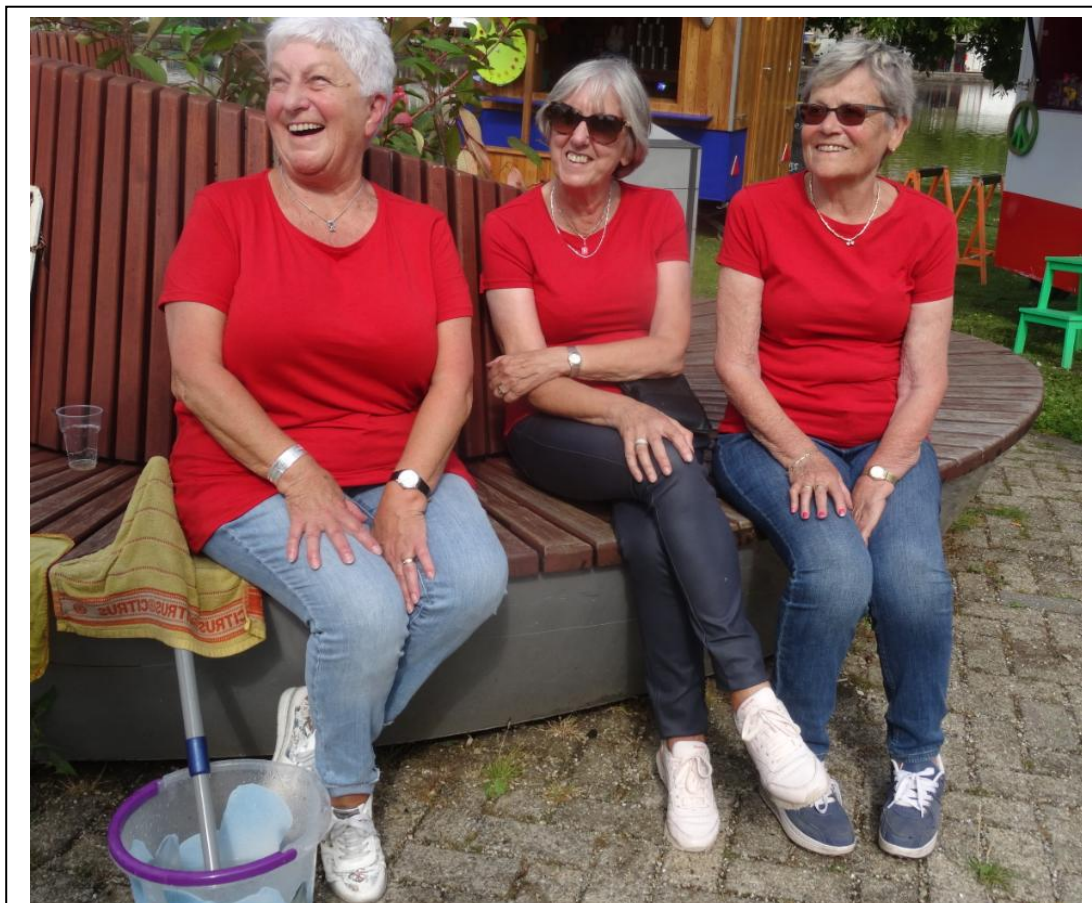
When the ladies smile ...