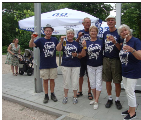
Nr. 3 – De Bermuda's.