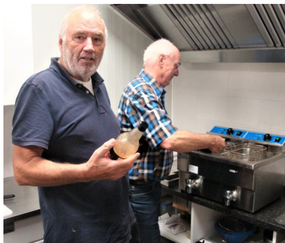
... en nieuwe gezichten in de keuken.