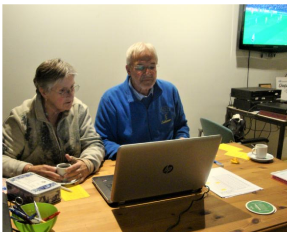
3 oktober - de donderdagavond competitie is weer begonnen ...