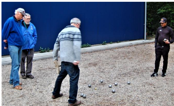
Team Klasse staat achter.

wist zich te herstellen en stevende af op de overwinning, 13-8. Klaasse, stoïcijns zoals een tireur het beste gedijt, bleek erg goed op schot en Reincke plaatste op het niveau van zijn hoogtijdagen. Daarmee is een team van JBC