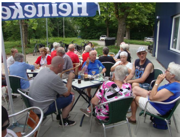
Nr. 2 – De Oude Garde

Zaterdag 27 juli was het zover. Het Zomer Sextetten Toernooi. De weersvooruitzichten waren redelijk. Zeven teams hadden zich aangemeld. Een team bestaat uit drie heren en drie dames.