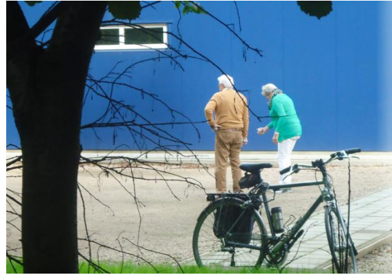
Zondag 18 oktober – gespot vanaf het hondenveld.

(Dichter Westerop in de bundel 'Hoornse Buitensingel')