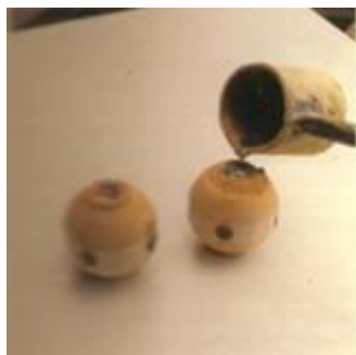
De gaten worden met lood gevuld.