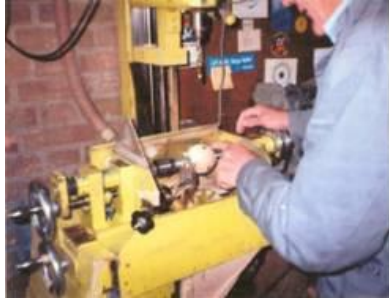
De kloot wordt rondgedraaid.

Door onnauwkeurigheden en verschillen in uitleg ontstonden er wel eens twistgesprekken die dan met de vuist werden beslecht en jarenlang mensen en gemeenschappen uit elkaar dreven. Er ontbrak nog duidelijk een overkoepelend orgaan.