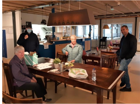
Leden die hebben geholpen bij het tellen van de stemmen bij de digitale ALV.