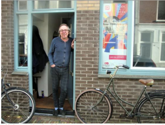
Bij het afscheid nog even een fotootje van de auteur.