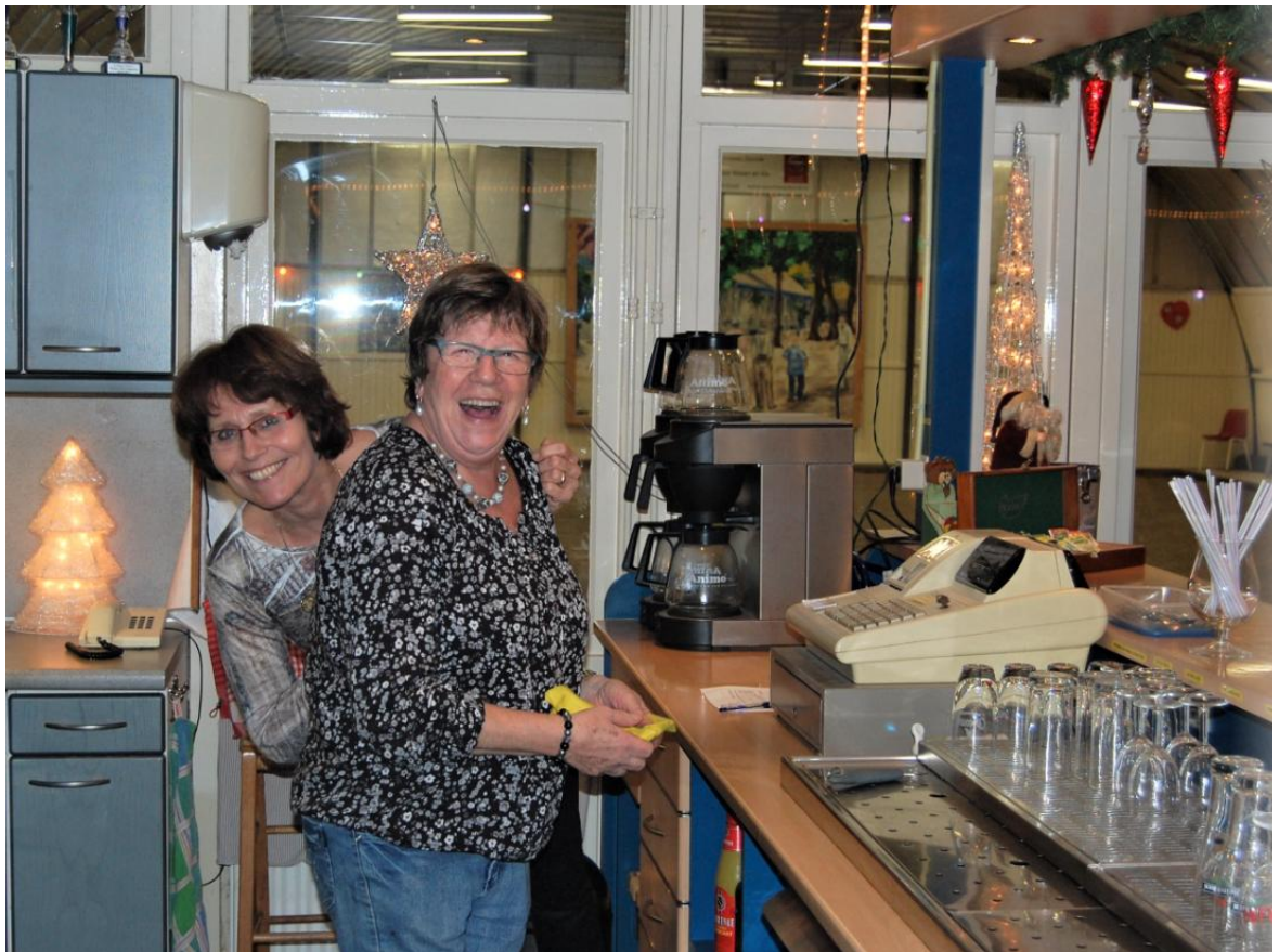
"We wensen iedereen een lachend Nieuwjaar!"