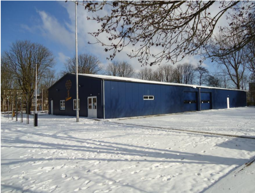
'Schoonheid in de winter'