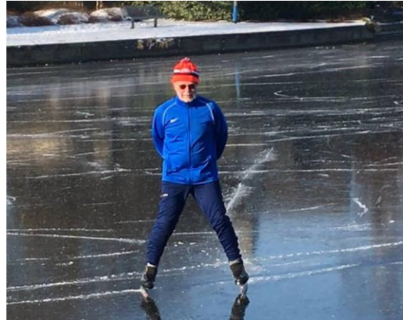
De andere Kant ...