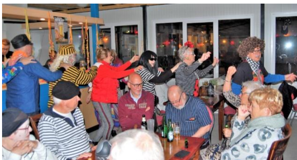
De polonaise bij JBC Zoetermeer.

Laat ik voorop stellen, ik ben geen carnavalvierder. De polonaise is ook niet aan mij besteed. Toch, in het verre verleden heb ik er tweemaal in volle overgave aan meegedaan.