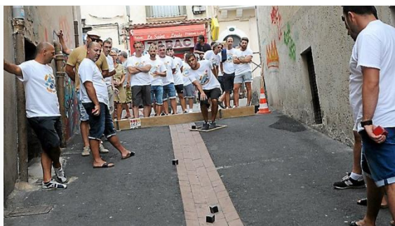
Gedocumenteerd door Frans Roos