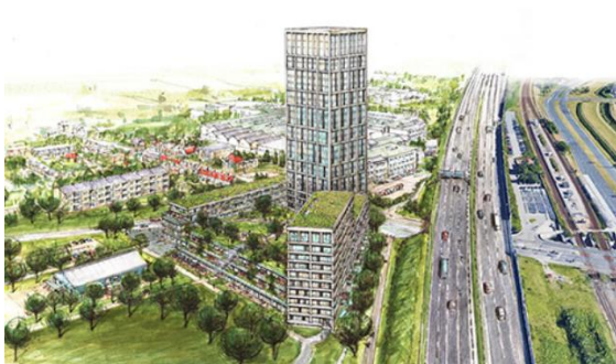
Situatieschets gebied rond A12, linksonder het bouldrome.

Uiteraard is het bekend dat er ook in onze stad een grote vraag is naar woningen, maar om nu een flat van maar liefst 90 (!) meter hoog neer te zetten pal achter ons bouldrome, was toch wel even schrikken! Het zal nog wel een tijdje duren voordat de bouw van start zal gaan omdat er nog veel werk is te verrichten. Zo moet o.a. het bestemmingsplan nog worden gewijzigd en door de gemeenteraad worden goedgekeurd, de samenspraak met omwonenden nog plaatsvinden en zal er overlegd worden met de vertegenwoordigers van de verenigingen van het Vernèdepark.