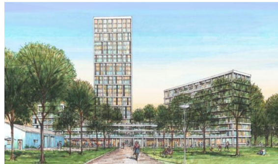
Situatieschets gezien vanuit het Vernèdepark, linksonder het bouldrome.

Ook zullen nog vele vragen beantwoord moeten worden over de hoogte van de woontoren, de ligging t.o.v. zon, wind en geluid en m.b.t. het behoud van het historische karakter van dit deel van de wijk. Over de bouw als zodanig lijkt echter al besloten te zijn (de woningbouw wordt als algemeen belang aangemerkt) en is dat politiek/ bestuurlijk al behoorlijk inhoudelijk afgedekt. Omdat het Vernèdepark als 'recreatieve doorloop' wordt gezien van deze woningbouw, wordt er dit jaar een start gemaakt met een 'nieuwe gebiedsvisie'