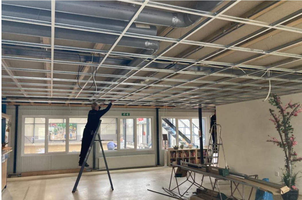
Werk in uitvoering